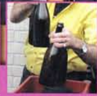
Altaar: personeelsleden anders bekijken