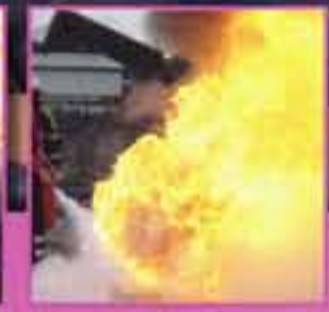
Preventie & Bescherming: brandbluwoefeningen